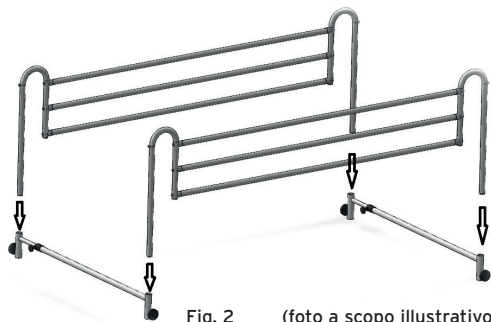
Fig. 2 (foto a scopo illustrativo)